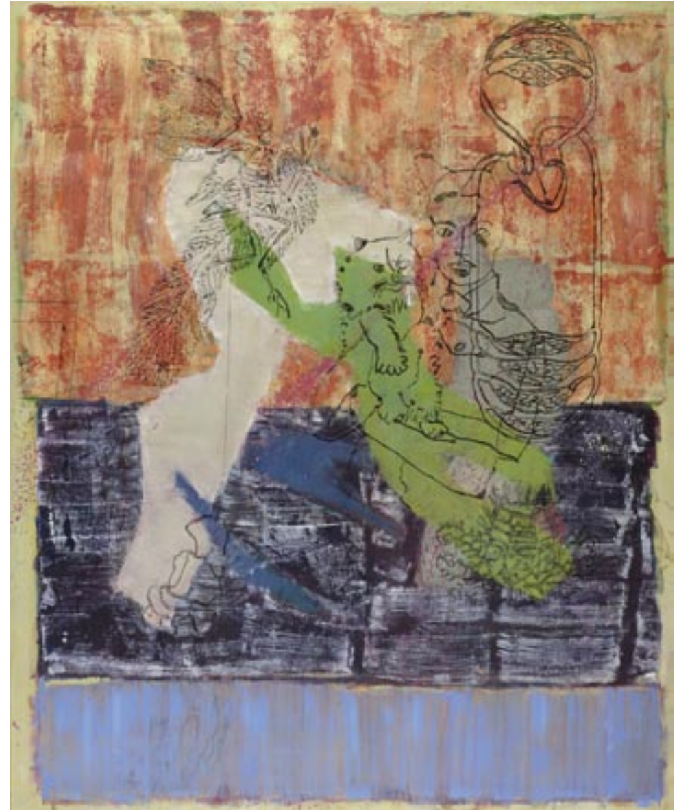
Frühzeit der Zu, 2007, Öl, Tusche auf Leinwand, 140 x 115 cm

Martin Conrad, 1954 geboren in Grünstadt, lebt und arbeitet in Hamburg Studium der Visuellen Kommunikation, Hochschule für Gestaltung Offenbach, Studium der Freien Kunst, Hochschule für Bildene Künste Hamburg