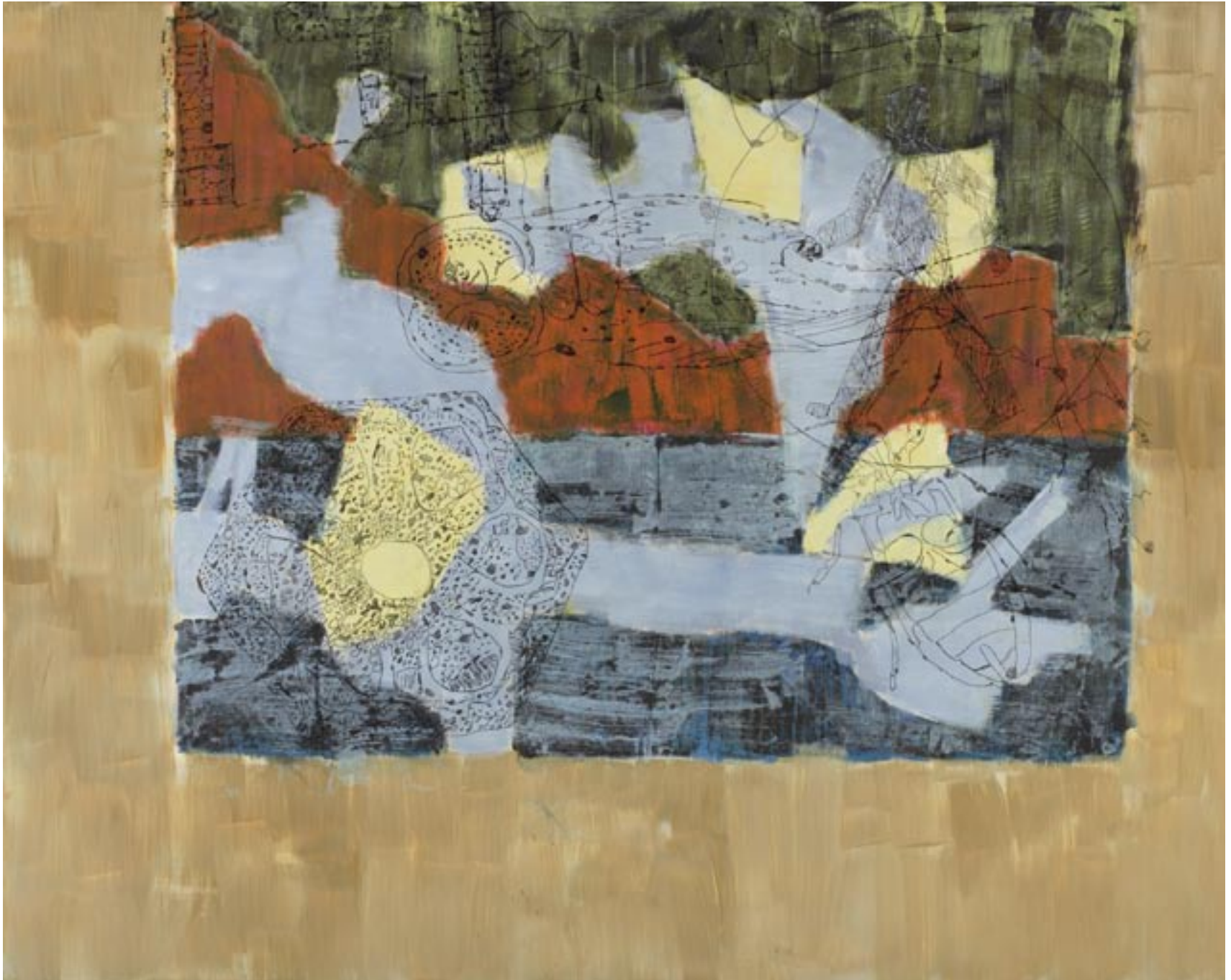
Eisscholleneulen, 2007, Öl, Tusche auf Leinwand, 140 x 180 cm