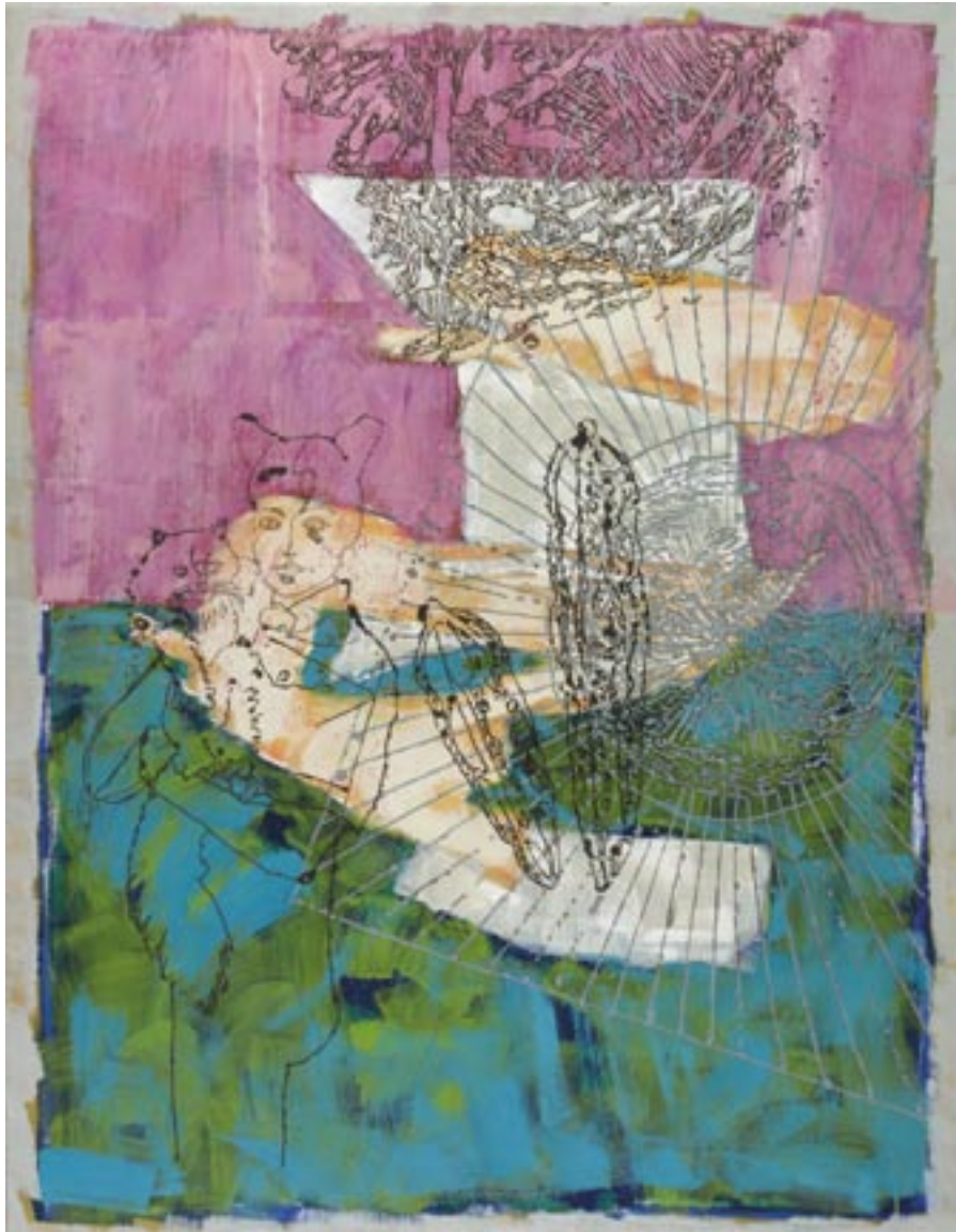
Ernutia, 2007, Öl auf Leinwand, 130 x 100 cm