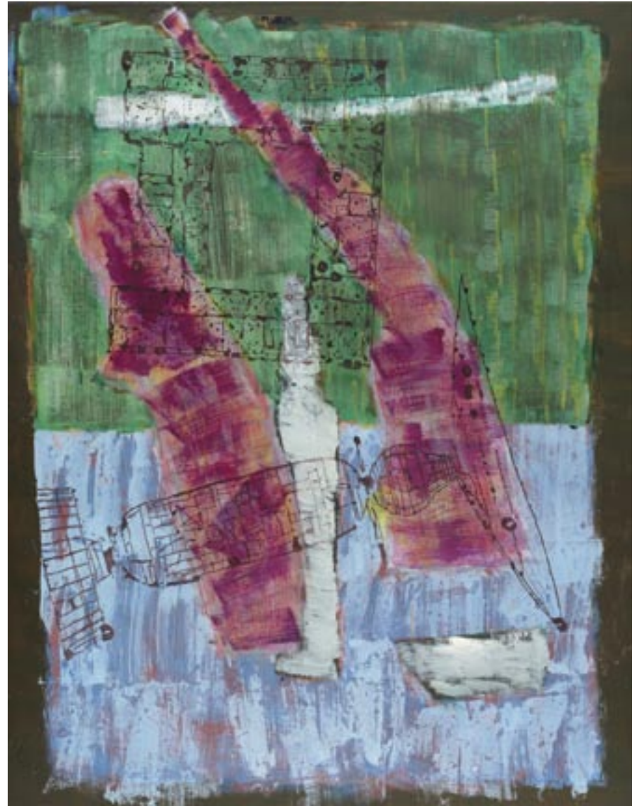
Messpunktholle, 2007, Öl auf Leinwand, 130 x 100 cm