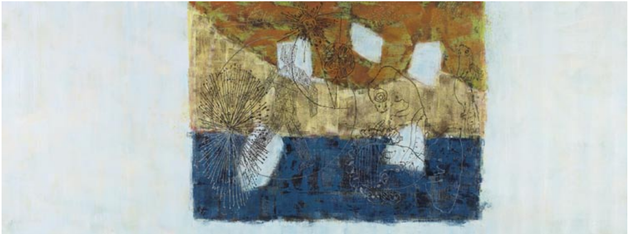
Stromland, 2007, Öl, Tusche auf Leinwand, 90 x 240 cm