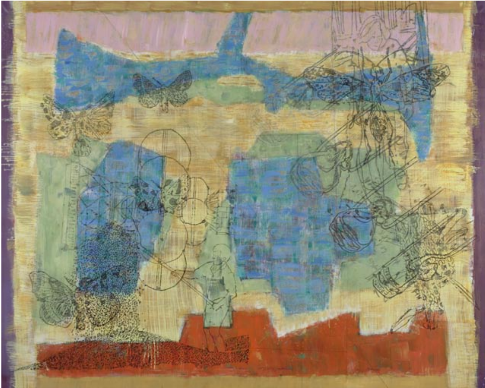
Pumpensystem, 2008, Öl, Tusche auf Leinwand, 160 x 200 cm