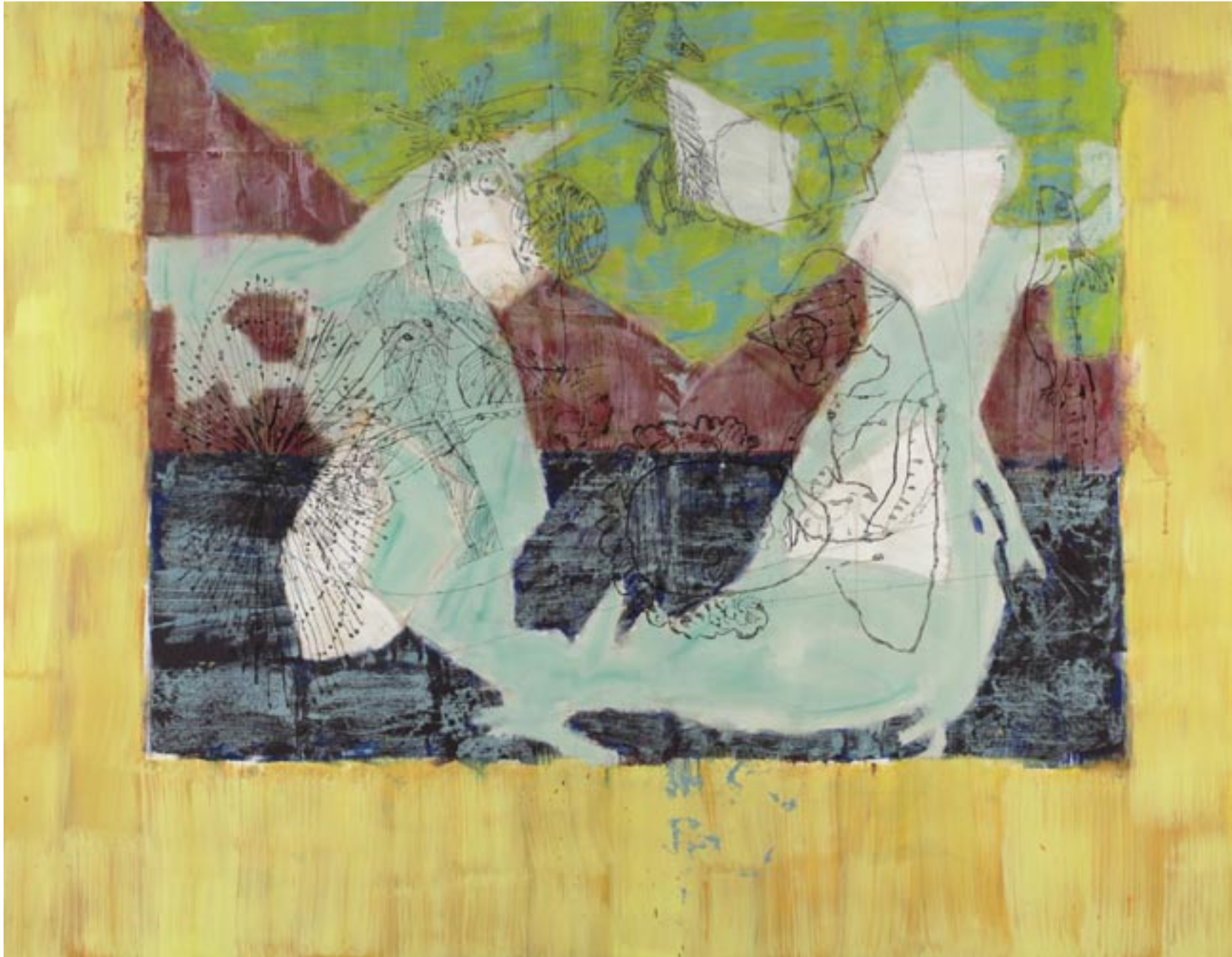
Metronome Ströme, 2007, Öl, Tusche auf Leinwand, 140 x 180 cm