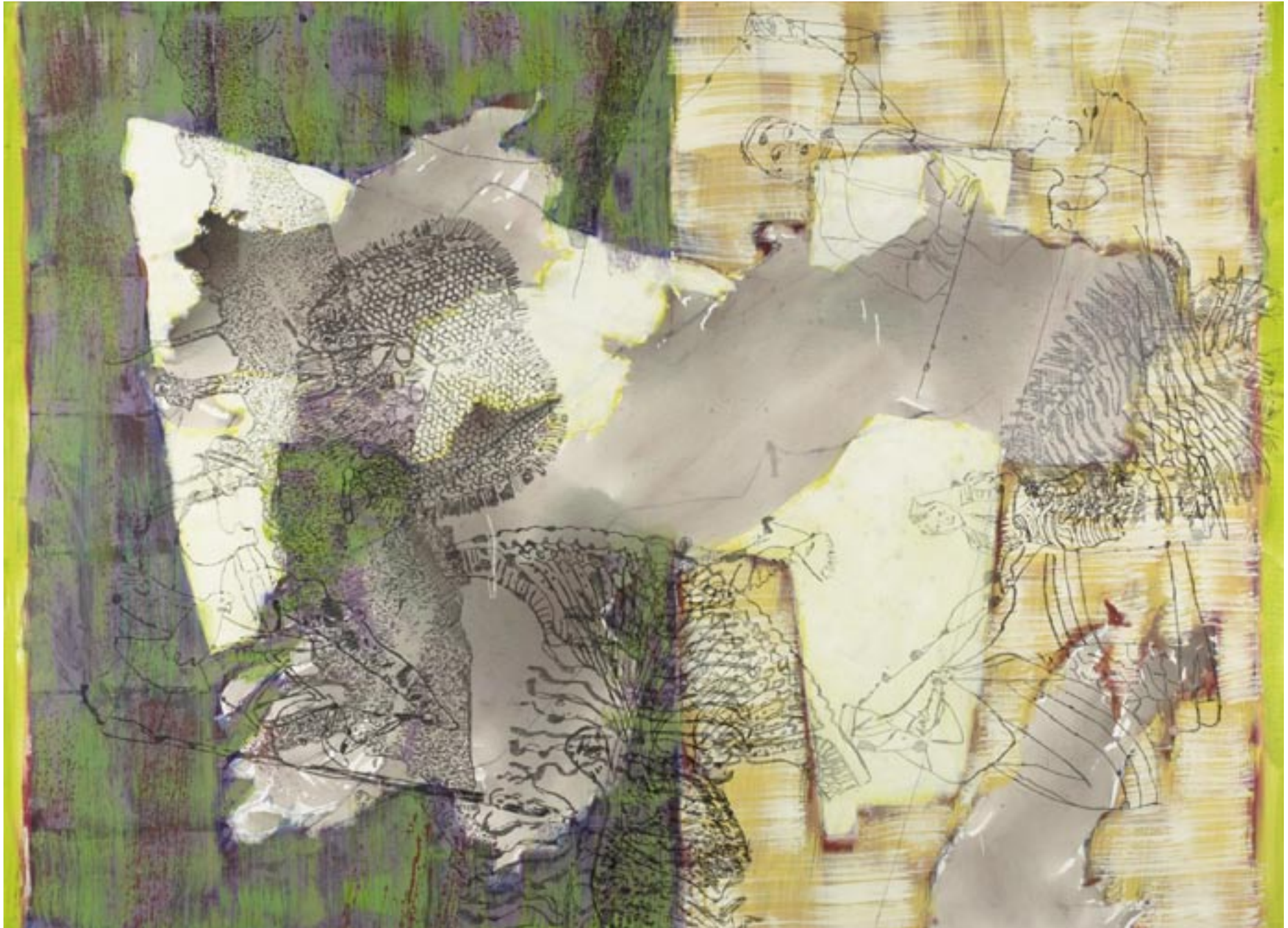
Unternehmen Lichtung, 2008, Acryl, Öl, Tusche auf Leinwand, 145 x 200 cm